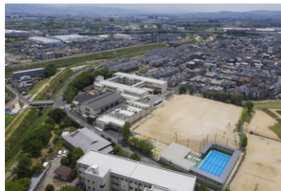
辻寅建設(株) 長岡第八小学校給食室・プール等建設工事 平成 31 年 3 月竣工 請負額/86,400 千円