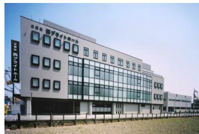
(株) 岡野組 公益社西プライトホール新築工事 平成 17 年 4 月竣工 請負額/71,400 千円