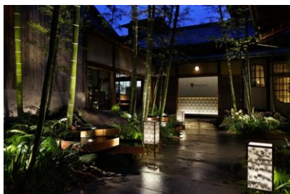
ミノベ建設（株） AKAGANE RESORT KYOTO HIGASHIYAMA 2期工事 平成26年12月 請負額/15,444千円