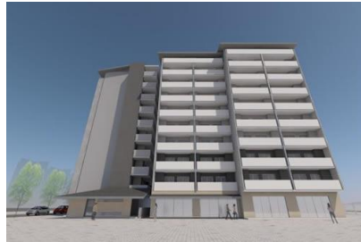
京都市 崇仁市営住宅新築工事（塩高ブロック） 令和元年9月竣工 請負額/138,080千円