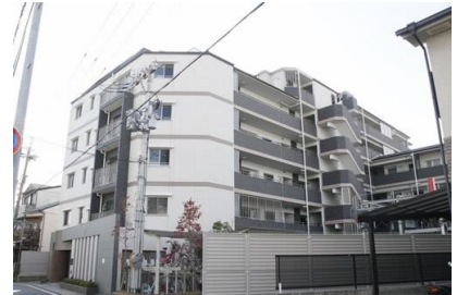
東海興業（株） 山科左義長町マンション計画新築工事 平成20年3月竣工 請負額/46,800千円