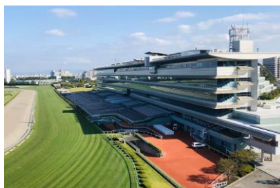
(株) きんでん 阪神競馬場場内改修工事 平成18年11月竣工 請負額/76,000千円