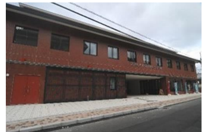
西松建設(株) 京都女子大学 K 校舎耐震補強等工事 平成 26 年 3 月竣工 請負額/26,250 千円