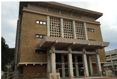
西松建設(株) 京都女子大学 B 校舎耐震補強等工事 平成 26 年 3 月竣工 請負額/257,775 千円