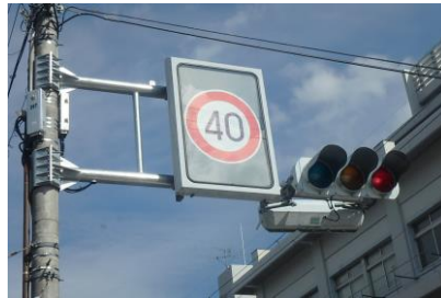
交通安全施設 可変式標識設備設置工事