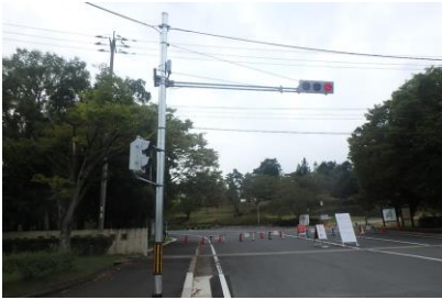
交通安全施設 信号機設置工事