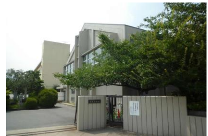
(株) 松村組 神足小学校・保育園等複合化施設工事 平成 28 年 3 月竣工 請負額/145,800 千円