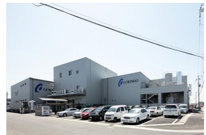
太平工業 (株) (株) 五健堂本社総合物流センター新築工事 平成 19 年 10 月竣工 請負額/40,500 千円