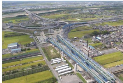
(株) 正興電機製作所 城陽 IC~八幡 IC 受配電自家発電設備工事 平成29年6月竣工 請負額/55,080千円