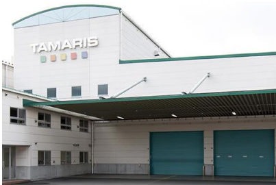
(有)ヨシオカ 大阪タマリス事務所改装工事 平成 19 年 12 月竣工 請負額/22,00 千円