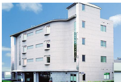
(株) 藤井組 公益社北プライトホール新築工事 平成 11 年 12 月竣工 請負額/63,840 千円