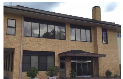
京都府 京都府職員研修所新築電気設備工事 昭和60年8月竣工 請負額/54,200千円