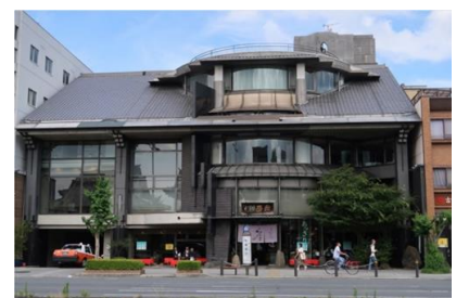
大成建設 (株) (株) 西利 本店 新築電気設備工事 平成 2 年 8 月竣工 請負額/42,930 千円