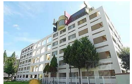
（株）大林組 大晋メゾネ北山通り新築電気設備工事 平成10年8月竣工 請負額/26,145千円