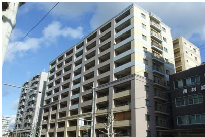
三和建設（株） イーグルコート西大路新築電気設備工事 平成16年3月竣工 請負額/76,998千円