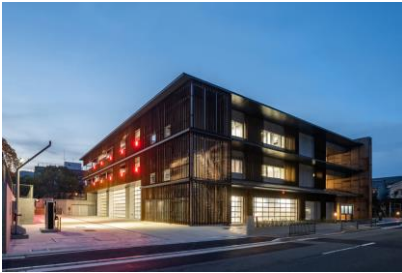
京都市 京都市新北消防署新築電気設備工事 令和3年3月竣工 請負額/236,500千円