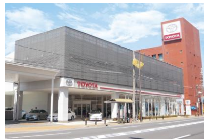
(株) 大林組 京都トヨタ自動車 (株) 本社店新築工事 平成 19 年 10 月竣工 請負額/43,400 千円