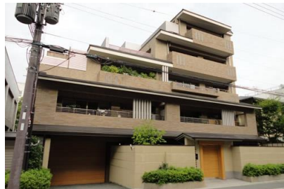
（株）大林組 グランエスパス御所東新築電気設備工事 平成19年8月竣工 請負額/26,000千円