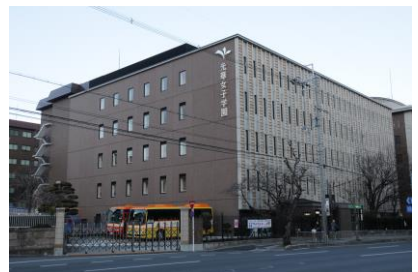
(株) 鴻池組 光華学園 70 周年記念棟新築工事 平成 22 年 12 月竣工 請負額/138,000 千円