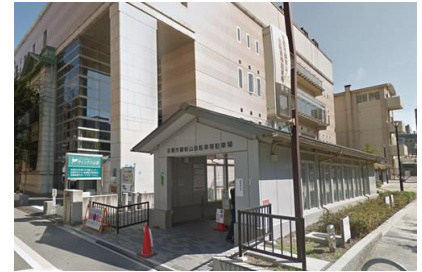
京都市 御射山公園地下自転車等駐車場整備工事 平成22年1月竣工 請負額/32,710千円