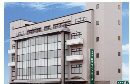
清水建設 (株) 公益社南プライトホール新築工事 平成 14 年 3 月竣工 請負額/63,840 千円