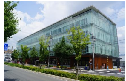
京都市上下水道局 西部営業所等庁舎新築工事 平成29年5月竣工 請負額/401,607千円