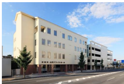
(株) 岡野組 公益社山科プライトホール新築工事 平成 24 年 9 月竣工 請負額/63,000 千円