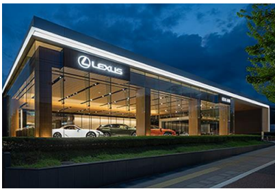
トヨタ T&S 建設(株) レクサス北大路改修工事 令和 2 年 9 月竣工 請負額/43,450 千円