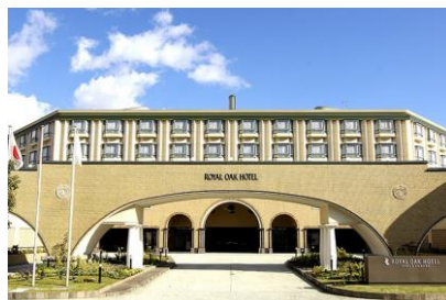
東邦観光株） ロイヤルオークホテル新築電気設備工事 平成2年7月竣工 請負額/983,675千円（196,735円）