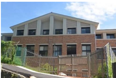
西松建設(株) 京都女子大学幼児教育棟新築工事 平成 25 年 5 月竣工 請負額/135,450 千円