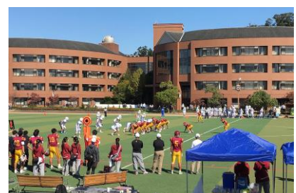
学校法人両洋学園 京都両洋高等学校体育館棟電気設備工事 昭和 60 年 5 月竣工 請負額/65,900 千円