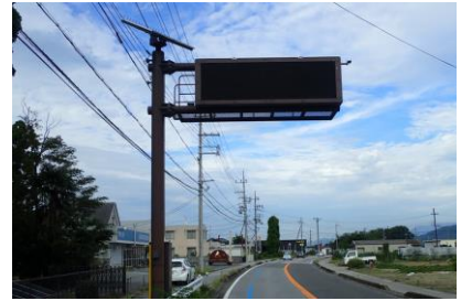
交通安全施設 道路情報表示機設置工事