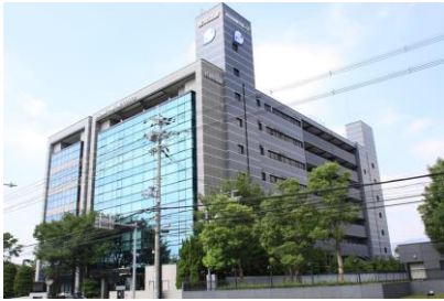
(株)大林組 佐川印刷株式会社 本社増築工事 平成 23 年 5 月竣工 請負額/162,000 千円