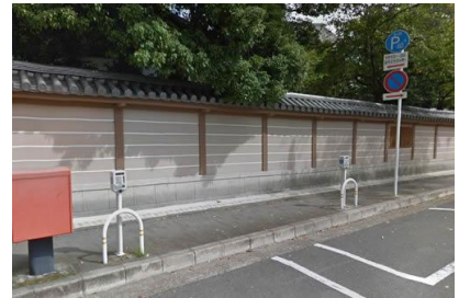
交通安全施設 パーキングメーター設置工事