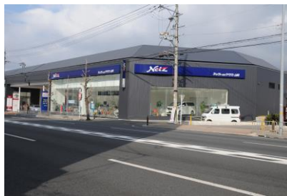
鹿島建設(株) ネットヨタヤサカ (株) 山科店新築工事 平成 22 年 1 月竣工 請負額/20,350 千円