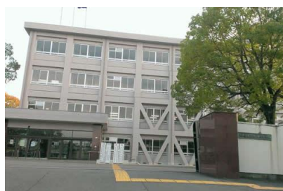
京都府 八幡高等学校管理棟耐震補強工事 平成 18 年 8 月竣工 請負額/1,335,600 千円(当社 267,120 千円)