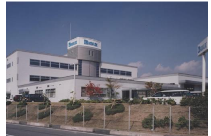
(株)大林組 コフロック (株) 宇治田原電気設備工事 平成 10 年 11 月竣工 請負額/117,600 千円