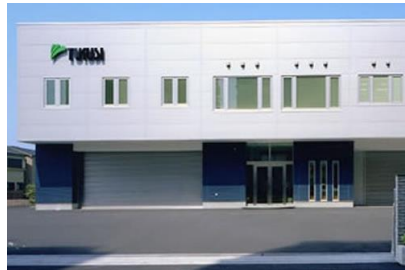
(株)大林組 (株) 筑紫本社及び工場新築電気設備工事 平成 18 年 6 月竣工 請負額/45,150 千円