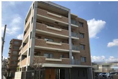
（株）大林組 長岡京マンション新築電気設備工事 平成16年4月竣工 請負額/44,100千円