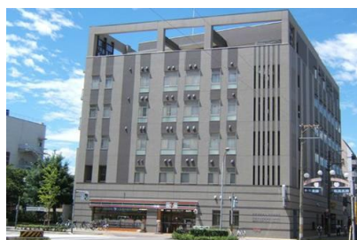
イワモトエンジニアリング（株） 介護施設じゅんぼう新築電気設備工事 平成17年4月竣工 請負額/70,350千円