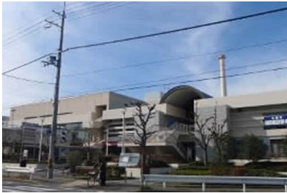
京都市 東余熱利用センター大規模改修電気工事 平成26年1月竣工 請負額/77,332千円