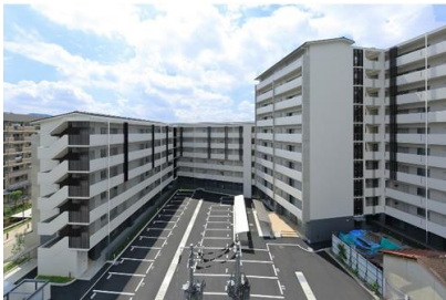
京都市 崇仁市営住宅新築工事（下中ブロック） 令和元年9月竣工 請負額/345,448千円（当社 207,269千円）