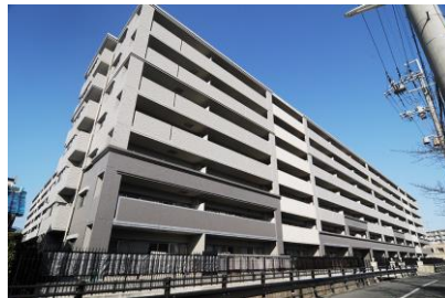
東海興業（株） エスリード三条天神川新築工事 平成19年8月竣工 請負額/203,000千円