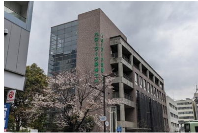
(株) 三煌産業 京都七条公共職業安定所電気設備工事 平成22年3月竣工 請負額/10,500千円