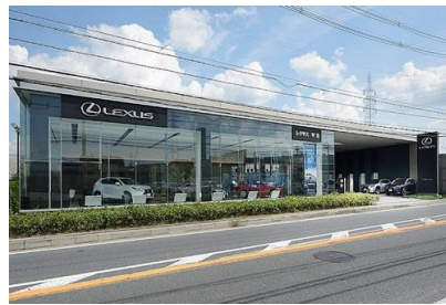
トヨタ T&S 建設(株) レクサス宇治改修工事 令和 1 年 8 月竣工 請負額/34,560 千円