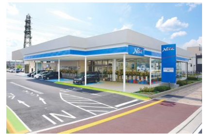
大和ハウス (株) ネットヨタヤサカ (株) 桂川店新築工事 平成 16 年 8 月竣工 請負額/35,964 千円