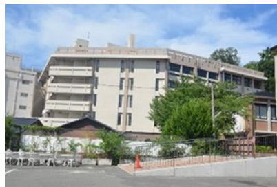
西松建設(株) 京都女子大学 C 校舎耐震補強改修工事 平成 25 年 5 月竣工 請負額/95,550 千円