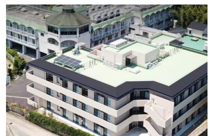
（株）ツバサ工務店 旭ヶ丘老人ホーム増設電気設備工事 平成4年2月竣工 請負額/42,230千円