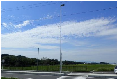
交通安全施設 照明灯設置工事