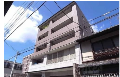
（株）大林組 グランエスパス御所南新築電気設備工事 平成19年8月竣工 請負額/26,000千円