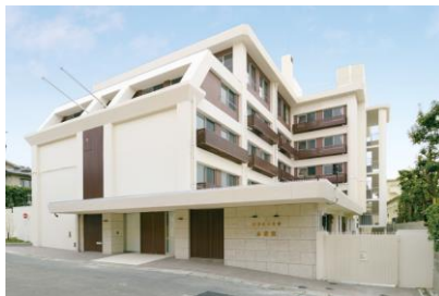
西松建設(株) 京都女子大学小松寮耐震工事 平成 28 年 3 月竣工 請負額/81,000 千円