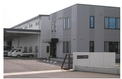
(株) エスジー建設 (有)木村製作所工場・社屋新築工事 平成 20 年 7 月竣工 請負額/14,500 千円