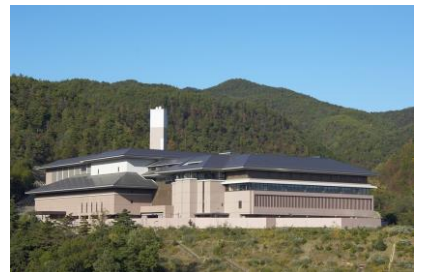
京都市 北部クリーンセンター新築電気設備工事 平成18年8月竣工 請負額/1,335,600千円(当社267,120千円)