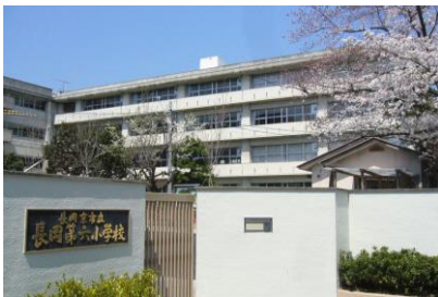
辻寅建設(株) 新田保育所・長岡第六小学校複合化施設工事 平成 31 年 3 月竣工 請負額/88,560 千円