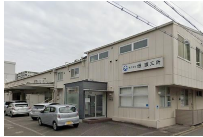
要建設(株) 畑鐵工所改修工事 平成 22 年 9 月竣工 請負額/13,200 千円