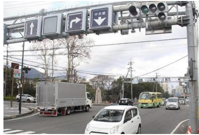
交通安全施設 交通車線変移システム設置工事