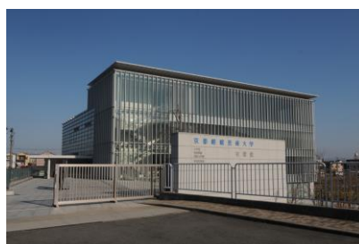
(株) 竹中工務店 京都嵯峨芸大羅原校舎新築電気設備工事 平成 16 年 4 月竣工 請負額/104,160 千円