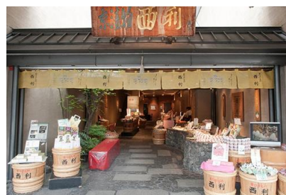
大成建設 (株) (株) 西利 祇園店 新築電気設備工事 平成 9 年 3 月竣工 請負額/18,170 千円