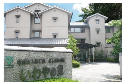
横田建設（株） 老人保健施設いわの里新築電気設備工事 平成10年11月竣工 請負額/103,950千円