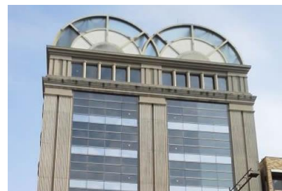
宝建設（株） イタリヤード本社屋新築電気設備工事 平成2年7月竣工 請負額/72,900千円