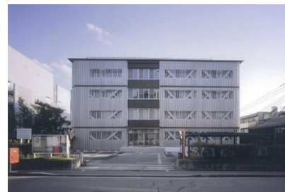
イワモトエンジニアリング(株) 京都農林総合庁舎改修工事 平成20年3月竣工 請負額/16,000千円